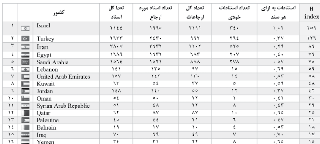
جدول (۳). مرتب سازی کشور های خاورمیانه براساس شاخص H-index در علوم زیستی.